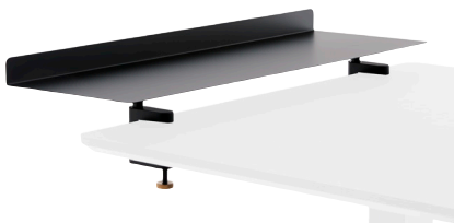
6000-0007-9000 Scandinavian Matte Black