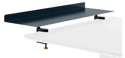
6000-0007-5008 Nordic Dark Blue