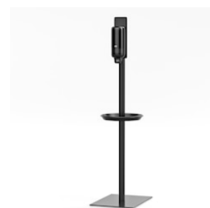
Tork Sanitizer Stand 511060