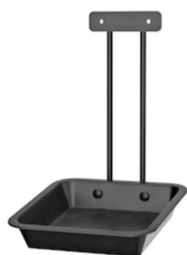
Floor Protector for Tork Sanitizer Stand 511049