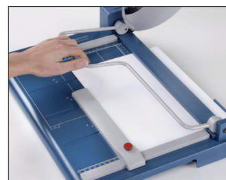
Håndpresse til optimal udnyttelse af skærekapaciteten