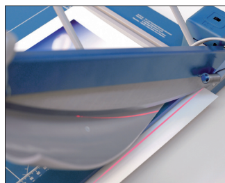
Laser stråle indikerer skærelinien