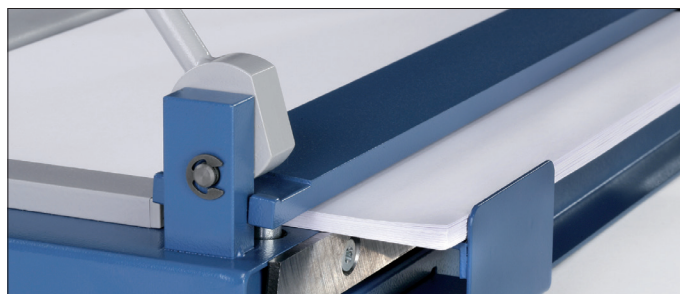
Høj skære-kapacitet. Skærer op til 38 ark papir 80/m 2