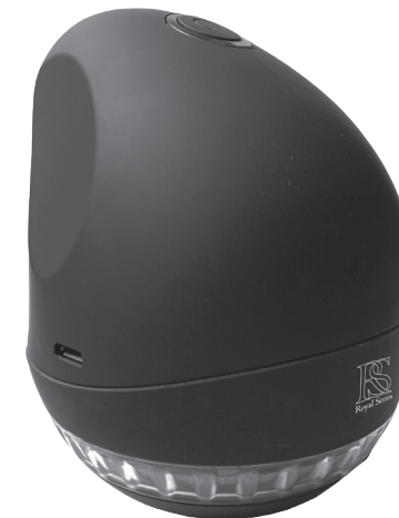
Brugervejledning Royal Genopladelig Fnugfjerner